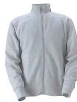
93 grey melange