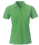
56 bright green