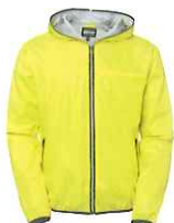
46 flourecent yellow