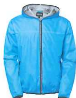
85 bright blue