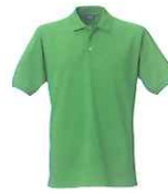
56 bright green