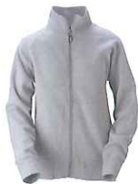
93 grey melange